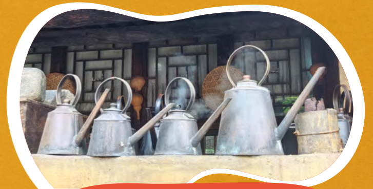
父辈时期的老茶壶 富瑞悦都 - 周童