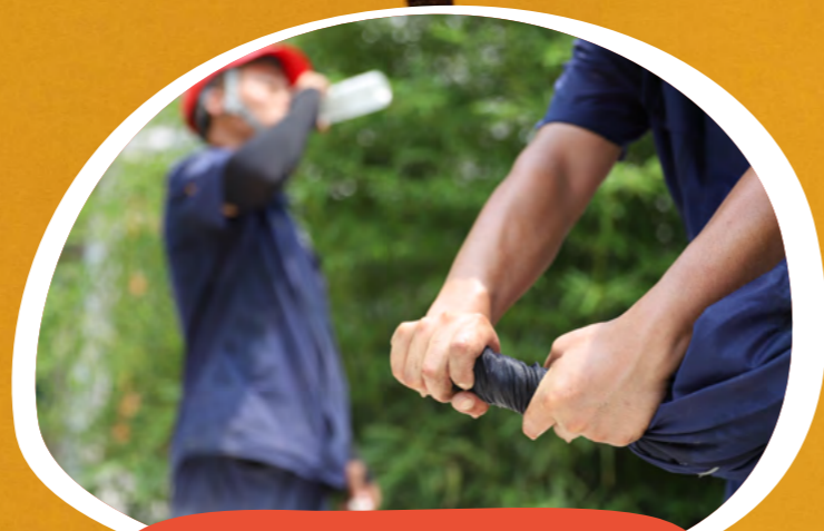
不惧“烤”验 奋战当夏 艾嘉科技 - 杨欢