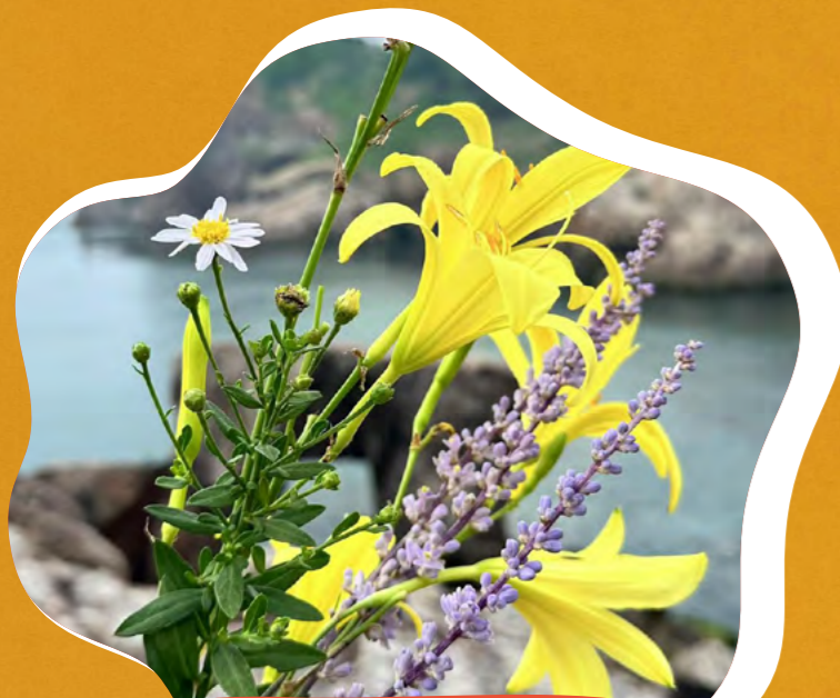
海边的自然之美 定兴富瑞安 - 韩桂璨