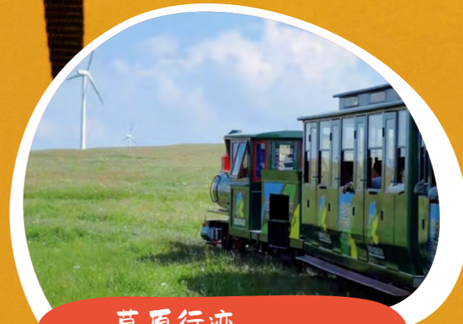
草原行迹 富瑞克工程 - 王沙沙