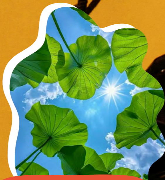
叶海映夏 碎光流天 富瑞克工程 - 孙亚丛