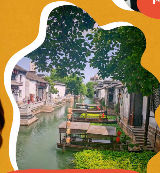
江南水韵 富瑞克工程 - 戴丽娟